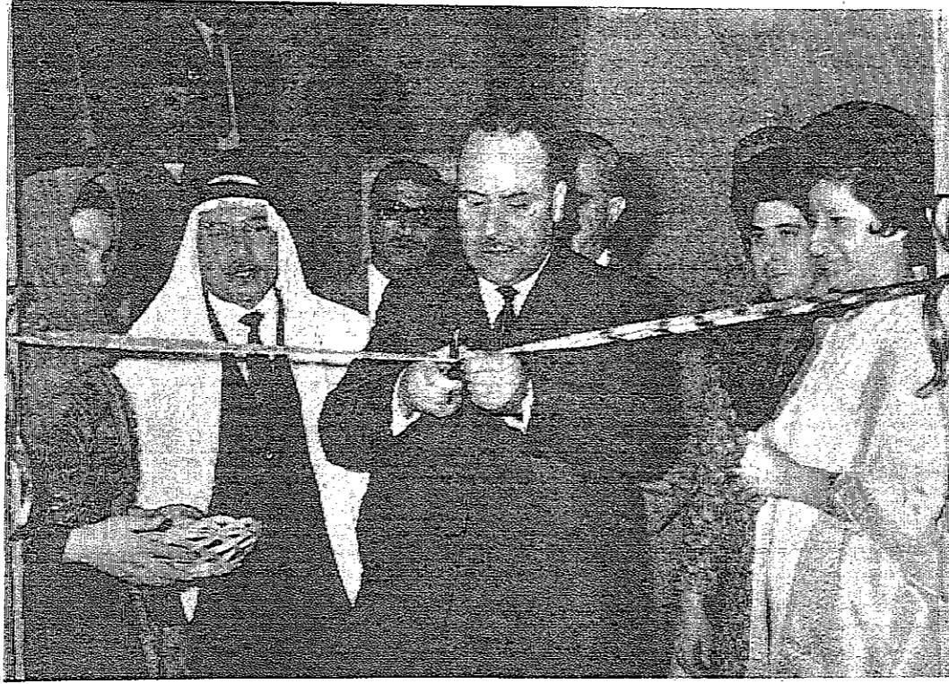
السيد بشير المصباح وزير التربية والتعليم يفتتح معرض التربية الفنية بعمان

عمان - طرقت الامة العامة لجامعة الدول العربية من الحكومة الاردنية ان تقوم بالتأهيل في امريكا لبرامج صالحة للعرض في الولايات المتحدة الاميركية عن الانسان العربي المعاصر ومشاكله وتاريخه وتاريخ المسرح العربي .